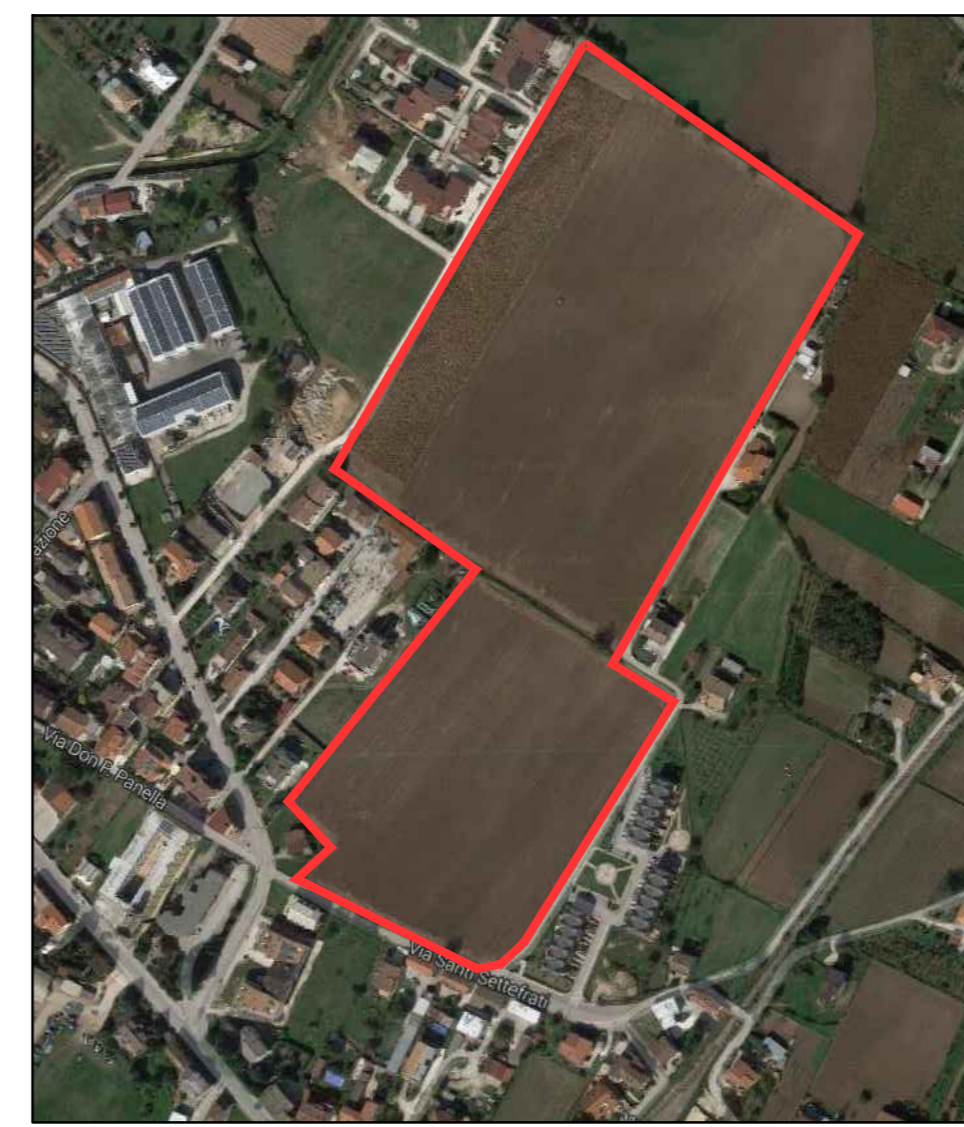
3. ORTOFOTO Area dell'intervento